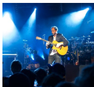
Fribourg auch by night