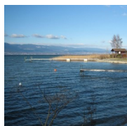
Fischzuchtanlage Estavayer—Erstellung einer PUK