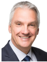
Compte de l'Etat de Fribourg - Jean-Daniel Wicht, député